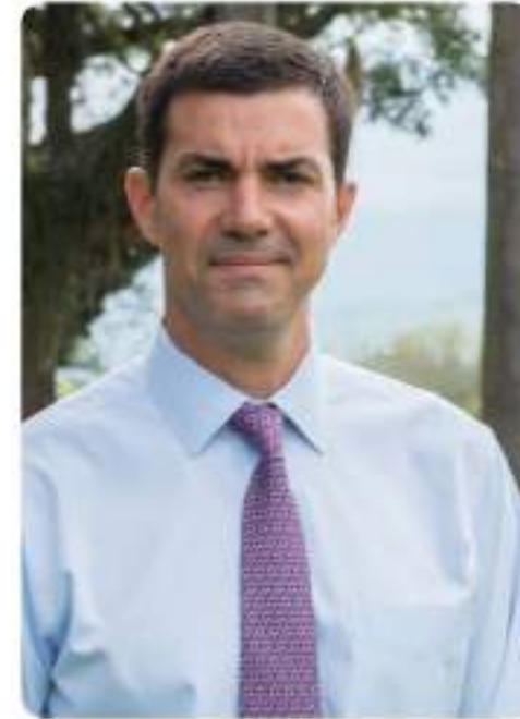
Dr. Juan Manuel Urtubey Gobernador de la Provincia de Salta

Un nuevo año de trabajo duro para las áreas de Cultura, Turismo y desde hace poco tiempo Deporte. La decisión de unificar deportes al viejo Ministerio de Cultura y Turismo resultó positiva, logrando amalgamar valores, objetivos y fortalecer aún más la política de inclusión y desarrollo de los salteños que implementamos desde el primer día de gobierno.